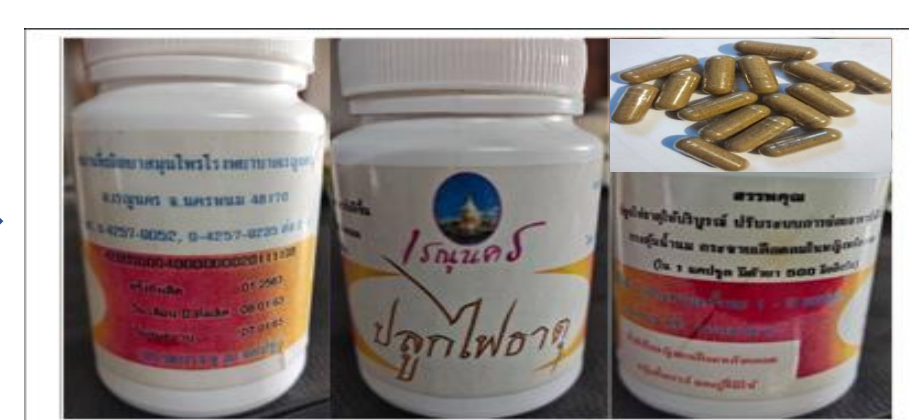
ภาพที่ 3 ยาปลูกไฟธาตุ