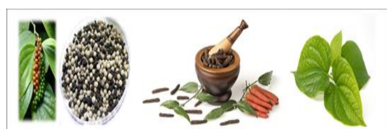
ภาพที่ 2 สมุนไพร